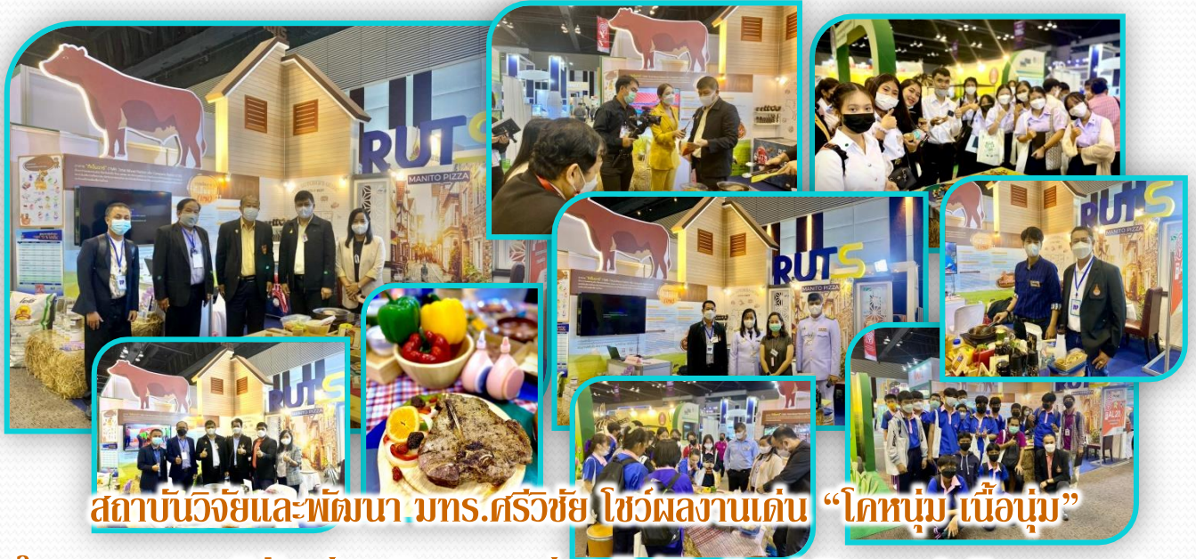
สถาบันวิจัยและพัฒนา มทร.ศรีวิชัย โชว์ผลงานเด่น “โคหนุ่ม-เนื้อนุ่ม”