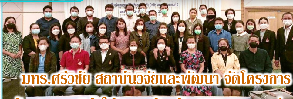
มทร.ศรีวิชัย สถาบันวิจัยและพัฒนา จัดโครงการ