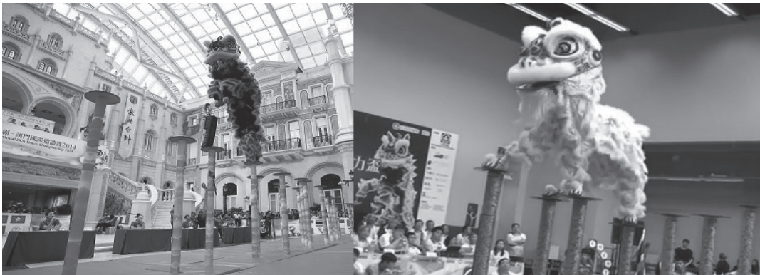
ภาพที่ 3 การแข่งขันเชิดสิงโตบนเสาดอกเหมย “MGM Macau International Lion Dance Championship 2014” (ภาพซ้าย) และคณะเชิดสิงโต “ศิษย์เอกท้าวมหาพรหม” ตัวแทนประเทศไทยใน “Yuen Long District Sports Festival 2014 - Hong Kong International Lion Dance Invitation Competition” (ภาพขวา)