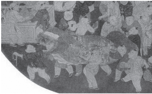
ภาพที่ 1 จิตรกรรม “Bai Zi Xi Chun Tu” แสดงการเชิดสิงโตกับเด็กๆ ในสมัยราชวงศ์ซ่ง

2) ราชวงศ์ถัง (ค.ศ. 618 - 907) และราชวงศ์ซ่ง (ค.ศ. 960-1279) ในสมัยราชวงศ์ถังถือได้ว่าเป็นยุคของการพัฒนาการเชิดสิงโต กล่าวคือ มีการแสดงดังกล่าวอย่างแพร่หลาย โดยมีผู้เชิด 2 คนที่แต่งกายด้วยชุดที่มีขนและมีลักษณะคล้ายสิงโต และมีอีก 2 คนคอยใช้เชือกและผ้าผืนยาวเล่นสนุกรอบๆ สิงโต นอกจากนี้ ในช่วงราชวงศ์ซ่ง ได้มีงานจิตรกรรมที่มีชื่อเสียง คือ “Bai Zi Xi Chun Tu” ที่แสดงให้เห็นถึงความสนุกสนานของการเชิดสิงโตกับเด็กๆ ดังภาพต่อไปนี้