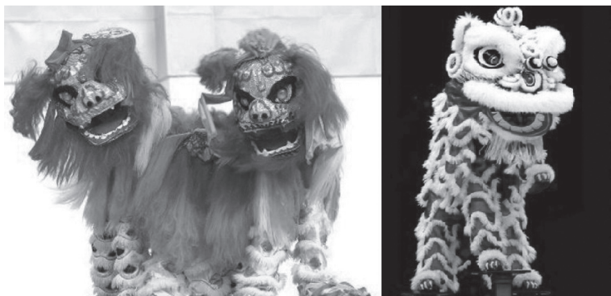
ภาพที่ 2 การเชิดสิงโตเหนือ (ภาพซ้าย) และการเชิดสิงโตใต้ (ภาพขวา)