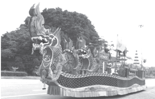
ภาพที่ 1 การพัฒนารูปแบบเรือพระบกในแต่ละปี

ในงานยังมีการแข่งขันกีฬาหลายประเภททั้งกีฬาสากลและกีฬาพื้นบ้าน และมีการแสดงของหมู่บ้าน เช่น การประกวดธิดาเรือพระ การประกวดขบวนรถบุปผชาติของแต่ละหมู่บ้านและส่วนราชการต่างๆ ในงานหนุ่มสาวยังเข้าร่วมแต่งกายชุดไทยย้อนยุค นำมาซึ่งความภาคภูมิใจของประชาชนและยังเป็นการสร้างรายได้และสร้างชื่อเสียงให้กับชุมชนตำบลเขาใหญ่และจังหวัดกระบี่ ดังคำกล่าวของมนตรี (2558) กล่าวว่า “สมัยก่อนคนมีเวลาว่างมาก จะนำอุปกรณ์ต่างๆ มาค้างคืนที่วัด ทำอาหารกินกันที่วัด ชาวบ้านทุกคนจะมาร่วมกันทำเรือพระจนเสร็จ แล้วลากไปยังหมู่บ้านอื่นๆ ถ้าน้อยลากไม่ไหว ก็ใช้ช้างลากแทนในปัจจุบันคนก็ยังนิยมแห่เรือพระกัน ซึ่งทาง อบต. ได้จัดงานสมโภชน์เรือพระบกออย่างยิ่งใหญ่ 3 วัน 3 คืน ที่วัดไพรสมณฑ์ ทุกคนเข้ามาร่วมตั้งแต่การประชุม วางแผน การแก้ไขปัญหาการทำเรือพระแล้วยังชักชวนผู้มีความรู้ศิลปะทั้งเด็ก เยาวชนและคนเฒ่าคนแก่มาร่วมงานเกิดเป็นกิจกรรมในชุมชนจนเรือพระเสร็จสมบูรณ์”