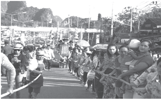
ภาพที่ 3 ประชาชนร่วมชกลากเรือพระบก

2. แนวทางการอนุรักษ์ภูมิปัญญาพื้นบ้าน การชักแห่เรือพระบกของตำบลเขาใหญ่พบว่า