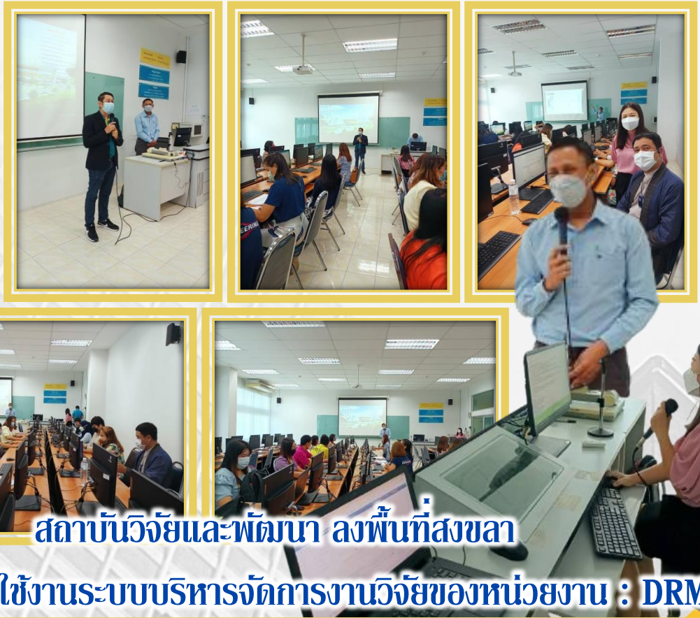
สถาบันวิจัยและพัฒนา ลงพื้นที่สงขลา